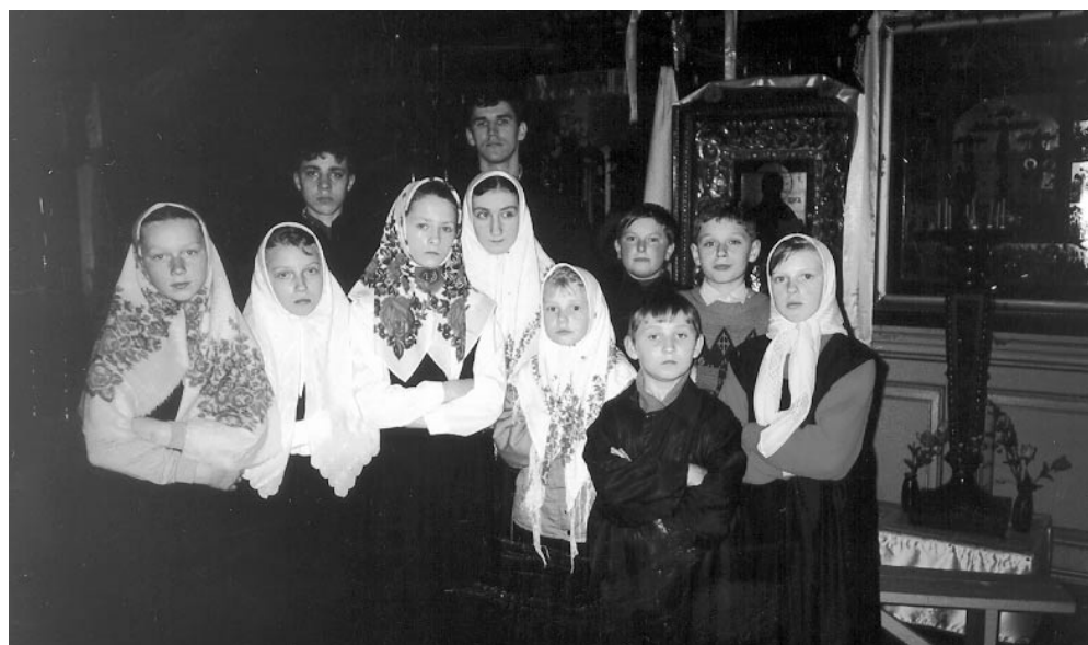
Молодые причетники Екабпилсского храма