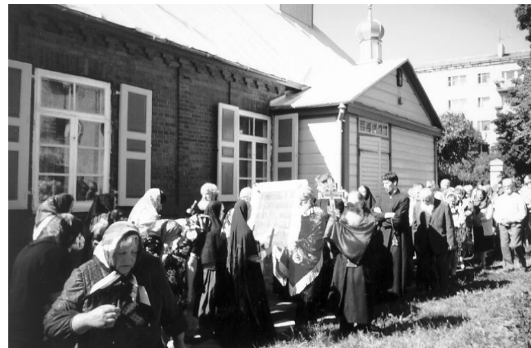
Крестный ход вокруг храма

уже 16 лет. За эти годы настоятель сделал очень много для того, чтобы храмом восхищались все молящиеся (и не только, я сам был