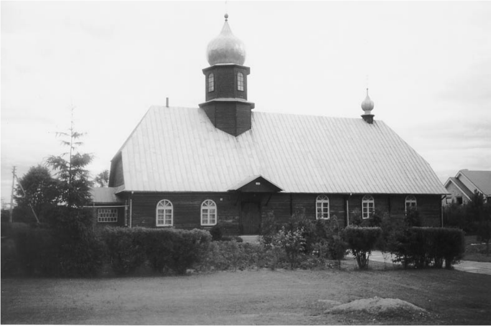
Храм в Утянах.

Пришли мы на землю мужа, где только растут две сосны, одну из которых он сам и посадил, да стоит знакомый с детства камень, на котором дети ждали возвращения отца, но он так и не вернулся, пропал на чужбине и никто не знает, где покойся его прах.