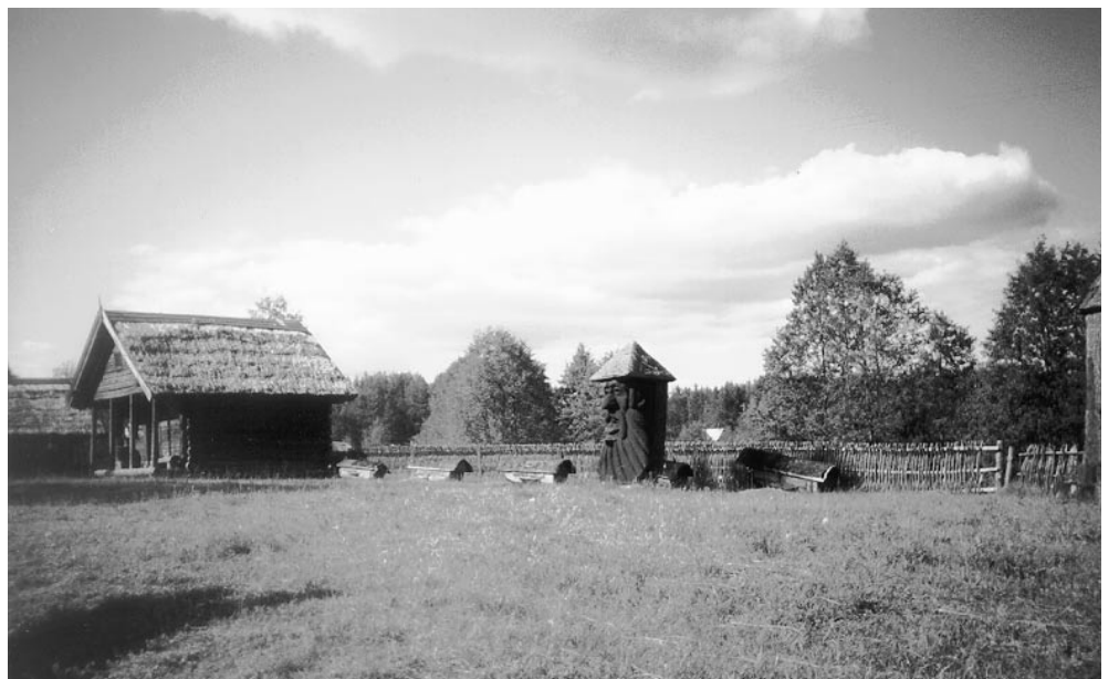
В музей-заповеднике пчел.

поминают отцов и братию нашу, всех православных христиан на кладбищах заупокойной литгией. В эти дни все стремятся выехать в родные места, посетить места упокоения близких, помянуть их души.