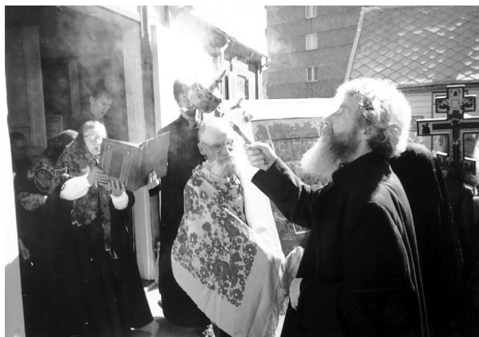
Выход Крестного хода