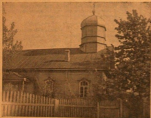
Храм Троицкий старообряд. общины в районе с. Рēzekне.