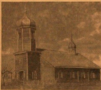
Храм Пажурский старообрядческий.