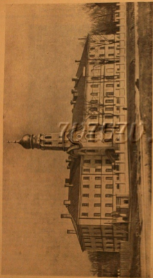
Облик мой города Рослова Григорьевскаго , святых обожания обожания и Рос