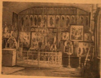
Храм Рождества Князьинской старообр. общины в с. Ревели, Литва, ССР (вверху — наружный вид, внизу — внутренний).