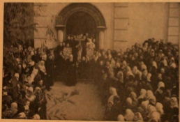
Выход крестного хода из храма Владимирской старообрядческой общины в день храмового праздника Покрова Пресвятой Богородицы 14 октября 1954 года.