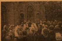
Крестный ход в Каристской старообрядческой общине, в с. Каристе, в день жезловской праздники, 9 мая 1954 г.