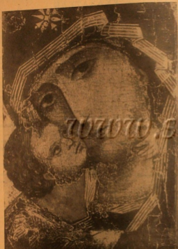
ОБРАЗ ПРЕСВЯТЫХ БОГОРОДИЦЫ ВЛАДИМИРСКОЙ (С ПОДЛИННИКА ЧУДОТА ИКОНЫ В ТРЕТЬЯКОВСКОЙ ГАЛЕРЕЕ)

Утром: тропарь воскрес 2-жды, Славо — кресточку, И ныне — предпразднству. Проче по канону все воскресн. Величье воскресно 3-е, до канон, кан. 65. Канон: воспр. по крестом на 4. В-че по 2, предпраздн. на 4 и муч. на 4. Катанаса — Глубино отгол остъ дн. По 4. Катанаса — кан. и кан. канон, канн. муч. Славо — св. муч. И ныне — св. предпразднству. По 6-ой песни каноника и канн предпразднству. Честнейшу поем. Стихеры воспр. 2-жды, Славо — И ныне — предпраздн. На каноника стихеры воспр. 4 и пред-