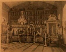
Старорусский храм (внутренний вид) в Казани, СССР, в д. Казань.