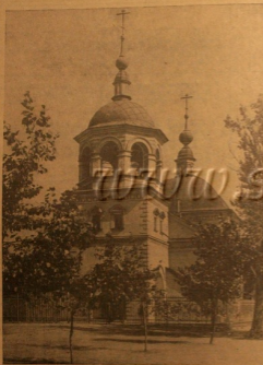
Храм Троицкий Преподобный старообрядческой общины в Москве.