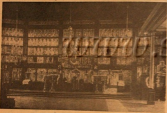
Внутренний вид храма (с правой стороны).

В настоящее время храм — поморско-братского согласия. Сохранив в точности свое название и являясь в. Храм существует с 1760 года. Об этом сказано и в «Сборнике материалов и статей по истории Прибалтийского края», т. IV, изд. 1882 г., Рига, стр. 540 (библиот. зав. № 1057). Здесь же, в книге, имеются подробные отчеты общины 1827 и 1880 гг. Община управлялась согласно статей, утвержденных маршалом Паузуни в 1827 г. Гребенщанская община имела тогда в своем ведомстве еще две молельни в Риге: у Иезуитов на Слово-церковной улице и близ Покровского кладбища (стр. 542 и 551), а также дачу Грименберг. В том же 1827 году сделаны были новые мостки на улице от площади до Дьяков, улица вы-