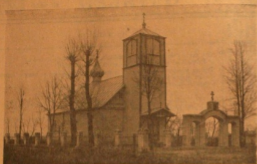
Храм Заставонской старобур. общины в дер. Заставки Ленинградской области. Ленин ССР