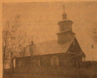
Храм Курбятинской старообрядческой общины