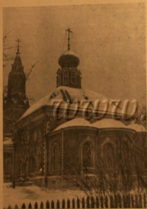
Храм Московской Поворной старообрядческой общины в Москве.