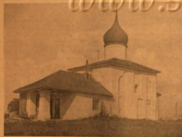
Старобуржуйский храм в с. Посол, работы архитектора XVI в. В этом монастырском храме старобуржуйцы этого исторического города, по обычаю своим предков, продолжают открывать свои духовные гробы.