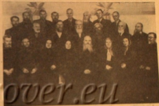
На снимке: духовный наставник и 21 член общины (четыре старообрядческие) и 2 члена Совета общины — 9 членов Совета общины и 2 члена общины Кавказа.