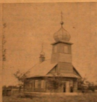
Храм Мстиславский старообрядцев, Могилевская область.