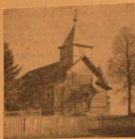
Храм Старобрыдской старообрядческой общины