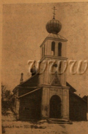
Храм Дарованской Свирской епархии старообрядческой общины в Лите, ССР.