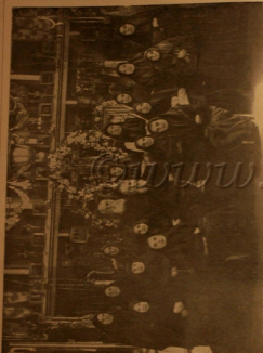
Гор. архив. Местность Гребеншиковской старообрядческой общины