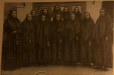
Любительский хор певчих Рижской Гребенжовской общины (многие из девушек участвовавшие в конкурсе).

На снимке показан любительский исполнительный хор певчих при мужском хоре Рижской Гребенжовской старообрядческой общины. По уставу является местной грядицей общины, классом поощряет только лица мужского пола, а хор певчих развивается за счет девочек, а девочки, между прочим и девками классами.