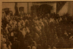
Важный крестный ход на узких дорогах исторического центра.

КРЕСТНЫЙ ХОД В РИЖСКОЙ ГРЕБЕННИКОВСКОЙ СТАРООВЕРЧЕСКОЙ ОБЩИНЕ В ДЕНЬ ХРИЗОВОГО ПРАЗДНИКА — УСПЕНИЯ ПРЭСЯТОГО Б-ЦЫ. В 1902 ГОДУ.