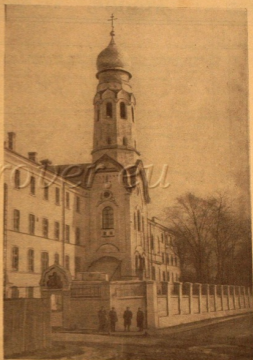
Колодеца при Рижской Гребенщицкой старообрядческой общине.