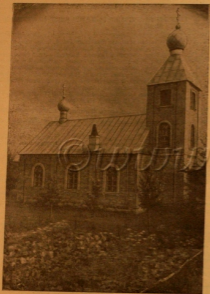
Храм Крестовый старообр. общины, Лето ССР.