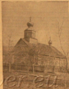
Храм Миколажевский старообр. общины в СССР.

24 июля — ДЕНЬ ВОЕННО-МОРСКОГО ФЛОТА СОЮЗА ССР.