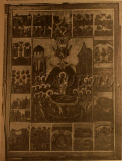
Реставрированный образ «Утеша Пречистой Богородицы», стариннейшее письмо XVI в. в Преображенской старообрядческой церкви, в Москве.