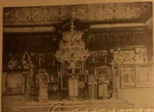
Внутренний вид храма вильнюсской старообрядческой общины.