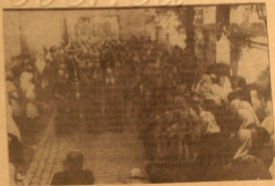
Ход крестный ход и «железные терки».