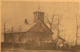
Храм Савельевской старообр. общины в Литовской ССР.