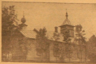
Храм Лубянский старообр. общины в г.р. Лубин Дале. ССР.

30 июня 1953 г. Советом Всемирного Совета Мира принята резолюция всех стран добиваться мирового разрешения спорных международных вопросов.