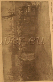
Крестный ход по кладбищу в Немецкой Преображенской старообрядческой общине в Москве, в старобрус Печене.