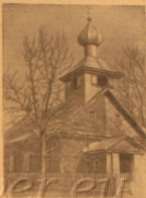
Храм Макарьевской старообр. общины в Литовской ССР.

5 мая 1952 г. открыты в г. Загорске, в Троице-Сергиевой лавре, первой в истории человечества Конференция всех духовной и религиозной объединений в СССР, посвященной вековой памяти Петра во все мире.