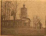
Храм Красноярский старообр. общины в Ленинградской ССР.