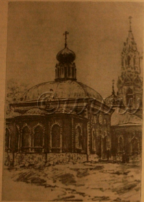
Кремль Московский старобразный алтарной общины в Москве