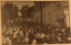
Отпавших крестный ход у трапезной школы Успення Пр. Б-цы, у ворот (под не Милунович дом).