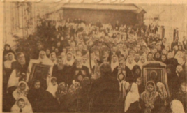
Крестный ход в Гурьевской старообр. общине Лена ССР в праздник св. Исаака Чудотв.